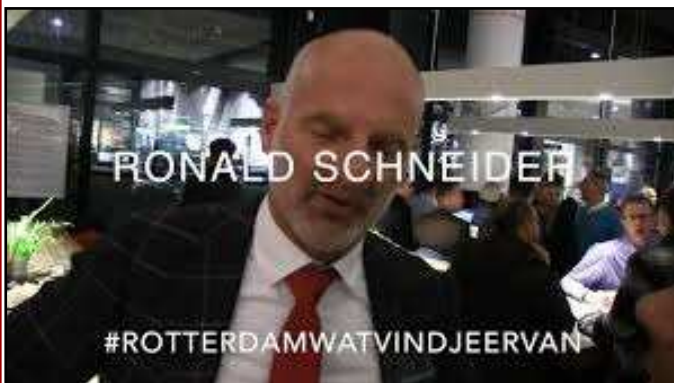
We gaan het hem vertellen!

We zijn er als RBvV voor de belangenbehartiging van de leden en niet als handhavers voor een zich terugtrekkende overheid!